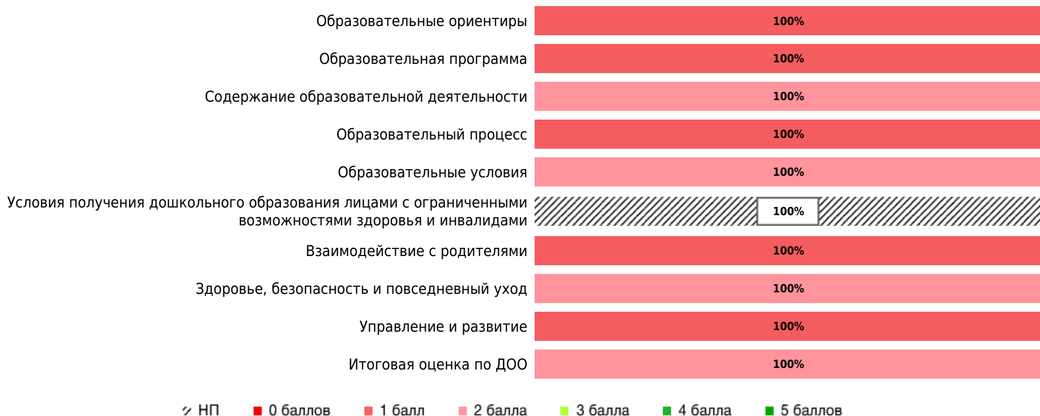
Доли ДОО с разными баллами (внешняя оценка)

В процессе внешней оценки по шкалам МКДО экспертами было оценено 1 групп(ы) ДОО из 1 ДОО субъекта РФ. Результаты внешней оценки качества образования в ДОО субъекта РФ по областям качества (по 5- балльной шкале):