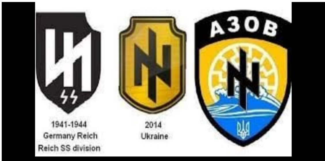
Рис. 2 Атрибутика украинских неонацистов и ее сходство с атрибутикой немецких нацистов прошлого века.